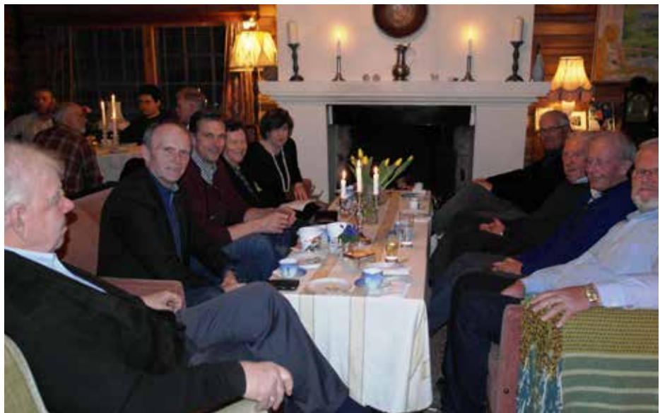
Peisemøte på Borgen