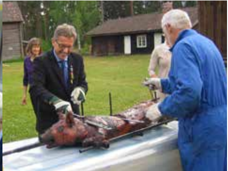
Presidentskifte 2014: Past president i gang med oppdeling.