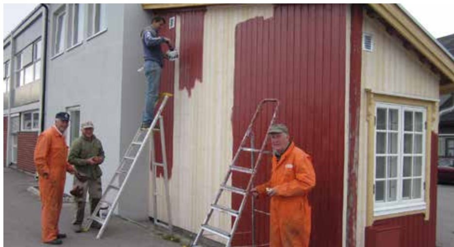
Trekanten males i 2012: