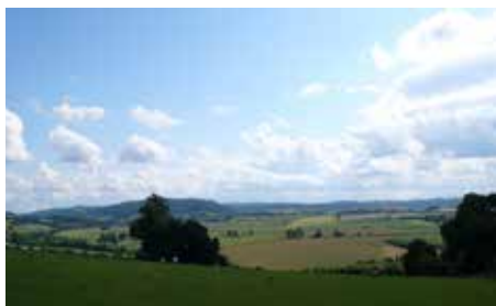
Ross On Wye 2008: Foto: Asgeir Sektan

Tilsvarende har vi forsøkt å gi gjestene innblikk i vårt næringsliv, kultur og histo-