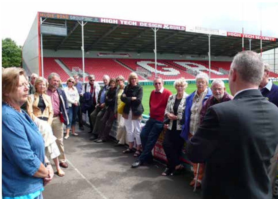
Gloucester Rugby: På besøk hos den lokale rugby klubben.

rie, både lokalt og ellers. Dette inkluderer skogbruk og næringsmiddelindustri, festninger og museer, Stortinget og Eidsvollsbbygningen, Skibladder og Maihaugen. Under veis har vi hatt hyggelige samvær med mat og drikke.