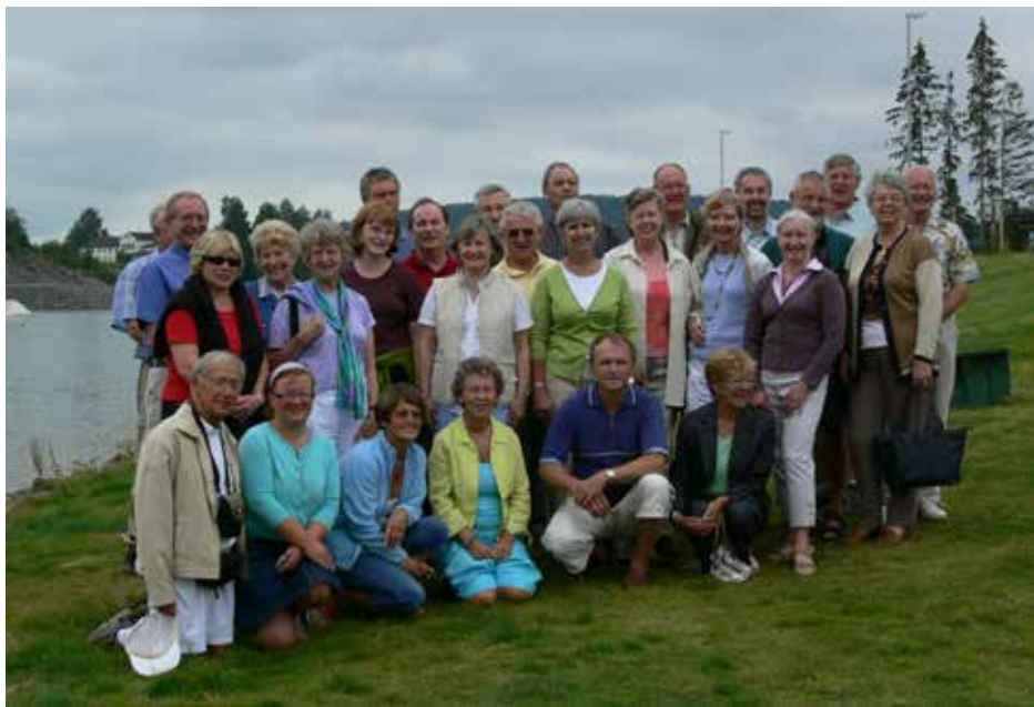
Ross On Wye besøk: Skarnes idretts- og aktivitetspark SIAP 29. Juli 2006